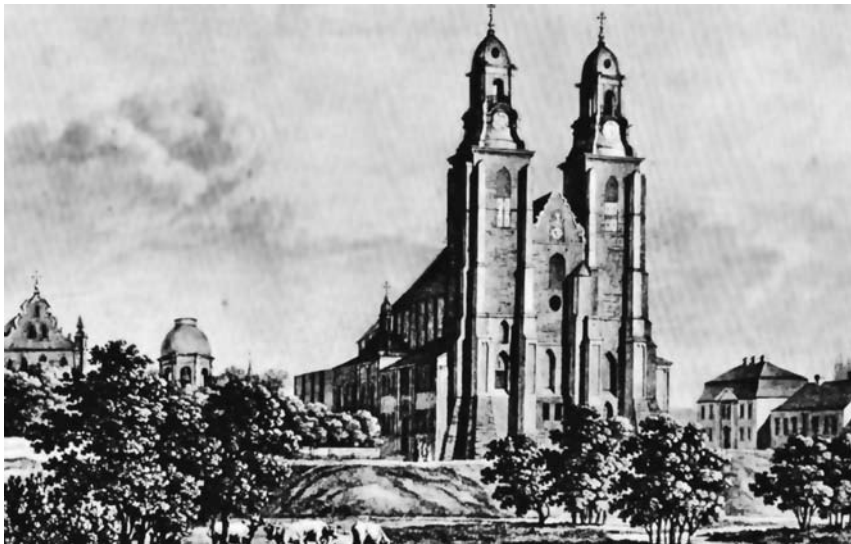
Ryc. 1. Wzgórze Lecha z katedrą, kościołem św. Jerzego i dzwonnicy. Staloryt J. G. A. Frenzla z 1829 roku.

Głównym celem badań była analiza stanu historycznego i aktualnego wybranych terenów zieleni miasta Gniezno z podkreśleniem zachowania panoram na dominantę Pomnika Historii Katedrę Gnieźnieńską. Miejsce to dla wielu pokoleń Polaków jest kolebką chrześcijaństwa polskiego i polskości. 2