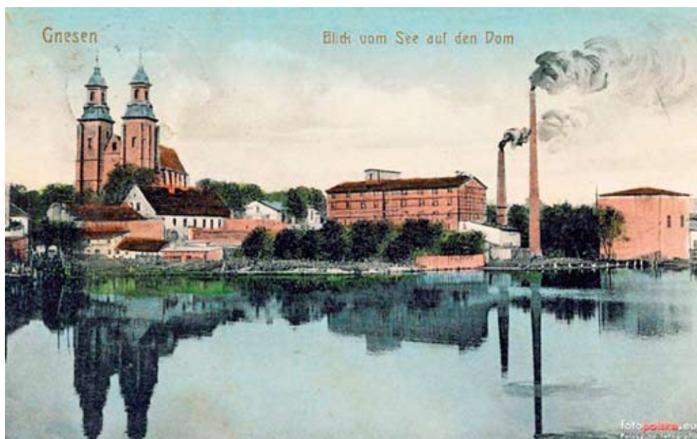
Ryc. 3. Pocztaówka z początku XX wieku, z widokiem na Katedrę Gnieźnieńską z zachodniego brzegu jeziora Jelonek.

Na początku XX wieku narastający chaos przestrzenny jak i industrialny charakter nadbrzeża Jeziora Jelonek w postaci między innymi dwóch kominów zdecydowanie zdewastował krajobraz miasta.